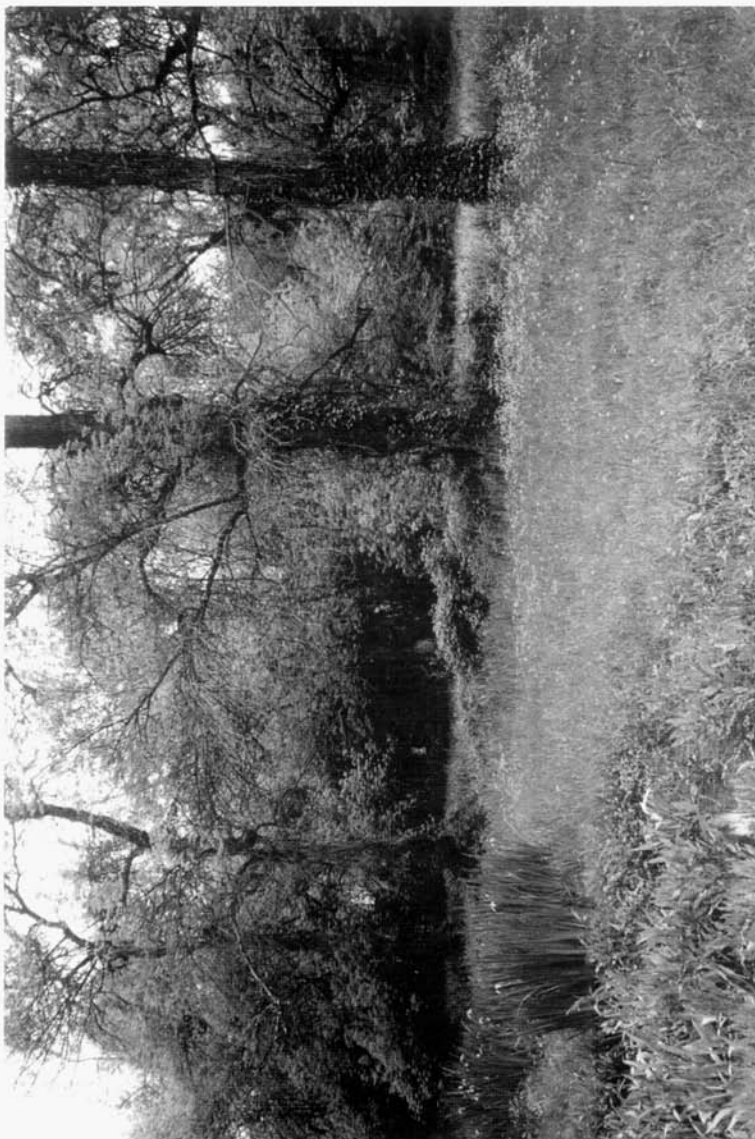
Fig. 2 : biotope de Rhacocleis poneli Harz : Villeneuve-Loubet, « Vaugrenier », Alpes-Maritimes